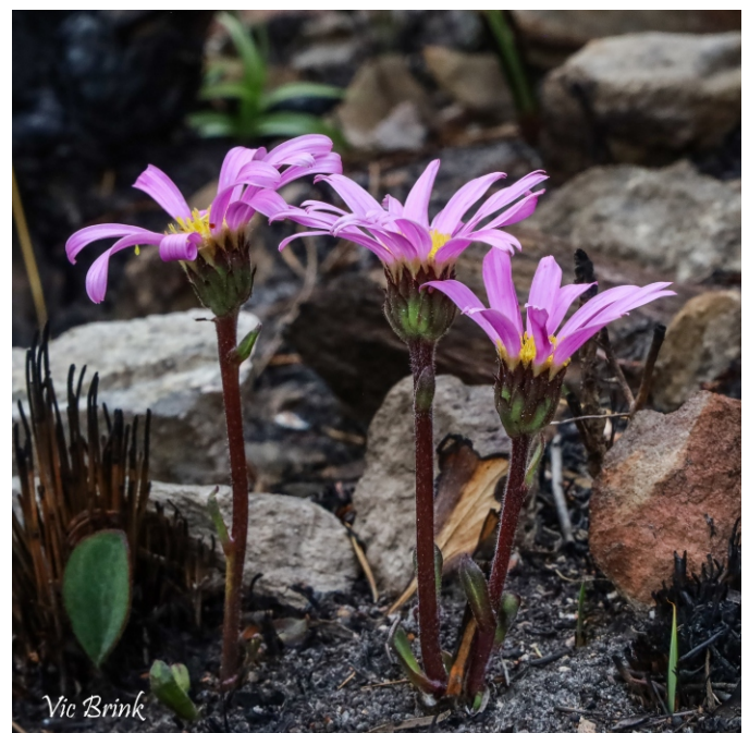
We'll have to wait for the next fire before we shall see Mairia coriacea , one of the fire daisies, again.

Some small trees such as Protea nitida (waboom) and Leucospermum conocarpodendron (kreupelhout) have thick bark that protects the trunk and branches. They can survive fires and resprout from buds under the bark.