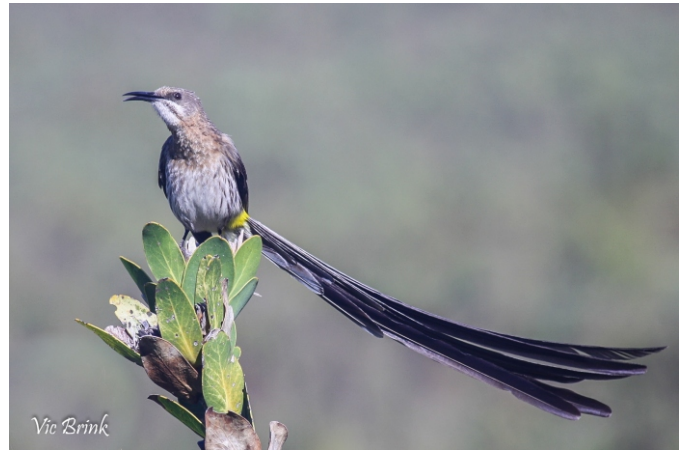
Cape sugarbirds ( Promerops cafer ) could fly away. They will be back when the veld recovers.