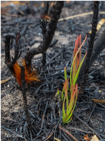
Protea scabra resprouting.