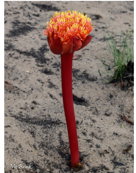
Haemanthus sanguineus always appears soon after a fire.

where they eat the nutritious coating or elaiosome, but leave the unharmed seed kernel underground. These seeds can survive for many years, protected from birds and animals. They germinate after a fire because of the changing temperature of the soil.