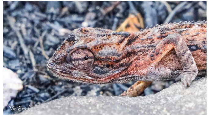
This Cape dwarf chameleon ( Bradypodion pumilum ) was found on Jean's Hill soon after the fire.

After a fire the veld looks black and devoid of life. However, this is an exciting time for all plant lovers. Every day brings something new as tender new leaves start to appear from the blackened soil, rare bulbs flower after only a few weeks, and insects and animals slowly return to their former homes. And those who are privileged to witness this explosion of life can only stand in awe of the resilience of the fynbos.