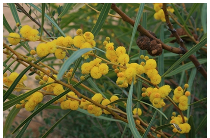
Acacia saligna (Port-Jackson), 'n bekende indringer.