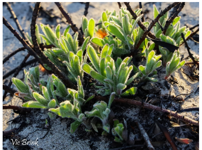
Leucospermum prostratum is a resprouter.