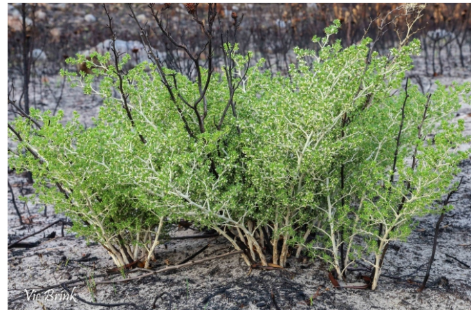
Asparagus aethiopicus , one of the pioneer plants.