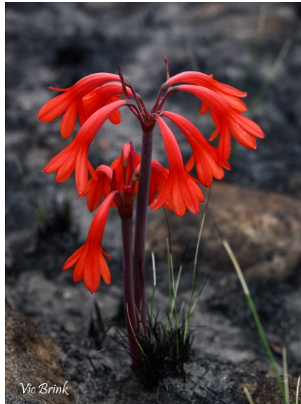
Cyrcanthus ventricosus , 10 days after the fire.