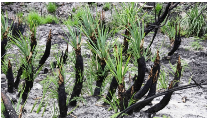
Tetraria thermalis (bergpalmiet) resprouting from burnt stems.

where they eat the nutritious coating or elaiosome, but leave the unharmed seed kernel underground. These seeds can survive for many years, protected from birds and animals. They germinate after a fire because of the changing temperature of the soil.